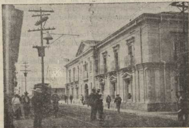
X Lugar en que estuvo la vieja iglesia de la Merced

«La ciudad está empedrada y alumbrada (el alumbrado se hacía entonces en faroles colocados en elegantes postes de hierro, que hoy se ven en una glorieta del Parque Central, situados en el centro de las bocacalles) y se van construyendo aceras cómodas en todas las calles.»